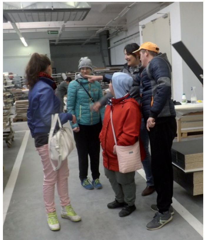
Wizyta w Zakładzie Pracy „FAST” w Skórczu