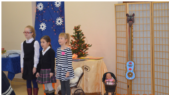
Konkurs "Kolandy Lólków Naszych"