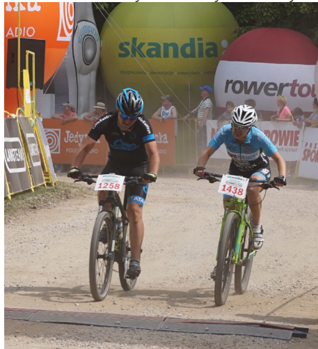
Od samego startu dawałam z siebie wszystko

Tak, najbardziej zadowolona jestem z ostatniego startu kończącego sezon podczas maratonu w Gdyni. Trasa była bardzo trudna, licząca 75 kilometrów. To najdłuższy dystans na jakim startowałam w tym sezonie, do tego w październiku gdzie aura pogodowa nas nie rozpieszczała na trasie. Podczas podejmowania decyzji odnośnie wyboru dystansu, nie do końca zdecydowana byłam na wybór