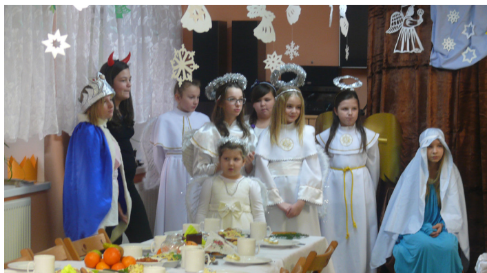
Spotkanie opłatkowe – Lalkowy

„Okres Świąt Bożego Narodzenia jest dla mnie magicznym czasem pełnym rodzinnego ciepła, rozmów, przemyśleń oraz podsumowań mijającego roku. To właśnie w tym czasie zaciągamy hamulec ręczny codziennego tempa życia, by cieszyć się atmosferą towarzyszącą strojeniu choinki, przyrządzaniu potraw czy zwykłym obowiązkom dnia codziennego, które z racji Świąt stają się niezwykle miłe.”