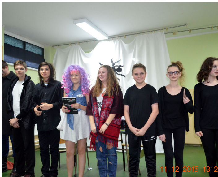
Dziady Anno Domini 2015

II etap to rozwiązywanie testu zawierającego 79 pytań różnego typu. Uczestnicy -trzyosobowe szkolne zespoły wykazywały się wiedzą na temat znajomości treści i problematyki wybranych dramatów, a