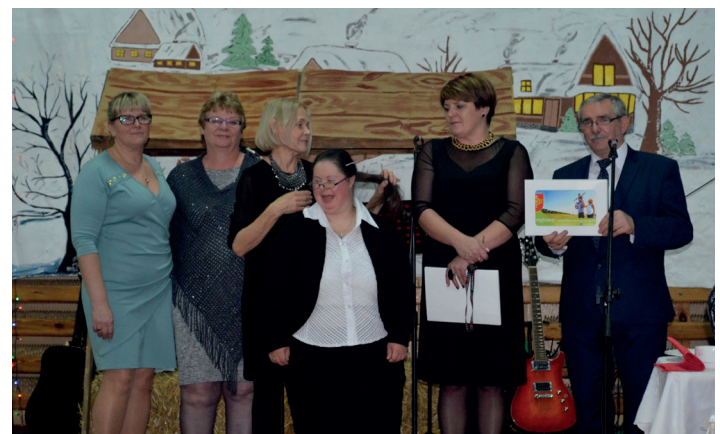
XII Spotkanie Wigilijne