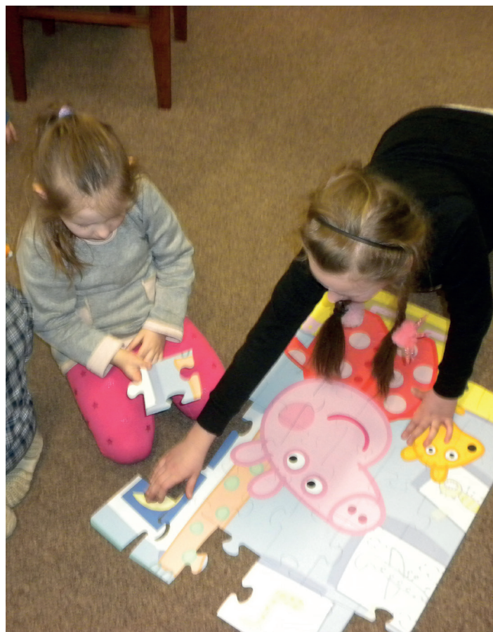
Nauka poprzez zabawę w Klubie małego czytelnika.