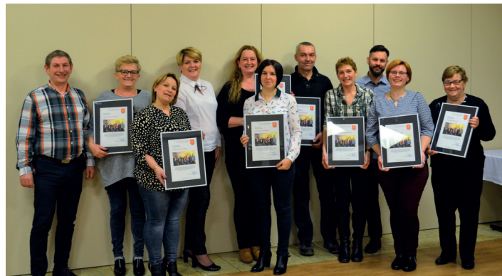
Dzień Sołtysa 2017

Śladem lat poprzednich Pani wójt Gminy Smętowo Gr., zaprosiła wszystkich sołtysów do wspólnego uczczenia ich ogólnopolskiego święta. Tym razem, 13 marca br. sołtysi spędzili czas bardzo aktywnie, sprawdzając swoje umiejętności w grze w krę-