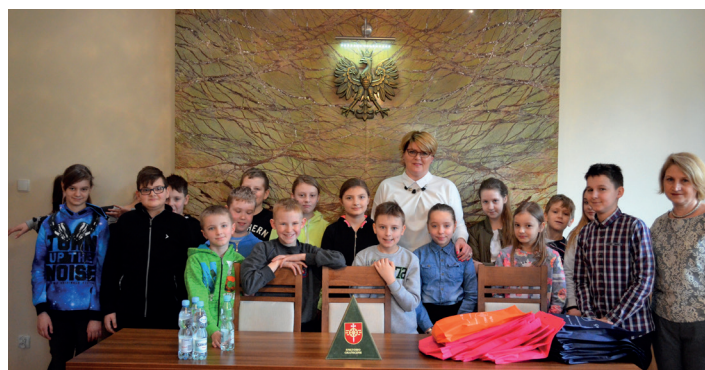
Spotkanie uczniów klasy 5 z PSP w Smętowie Gr. z władzami gminy.

Kilka dni później także w ramach programu, młodzież miała za-