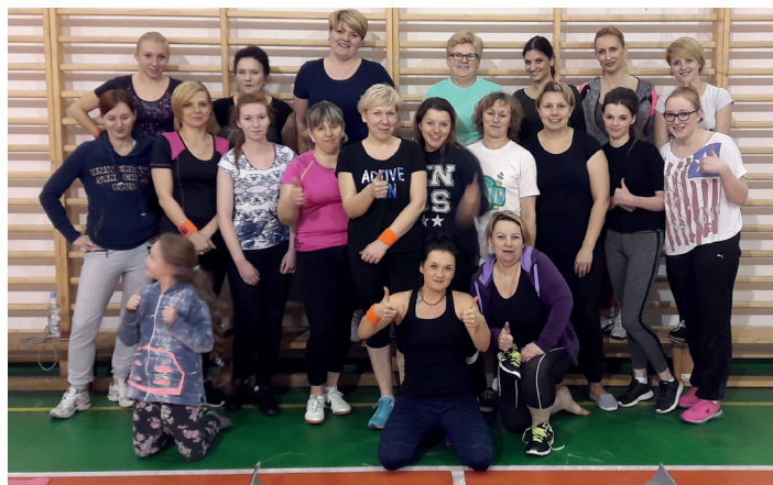
Maraton fitness w Kopytkowie.

Swoją propozycję uczczenia święta pań, miały również członkinie lokalnych Kół Gospodyń Wiejskich oraz Gminnego Koła Emerytów, Rencistów i Inwalidów. Na wspólne granie i śpiewanie zawsze jest pora. Wystarczy znaleźć dobrą okazję, jaką na przykład stwarza dzień 8 marca, naturalnie. Na stole nie zabrakło słodkości, a w świetlicach wiejskich