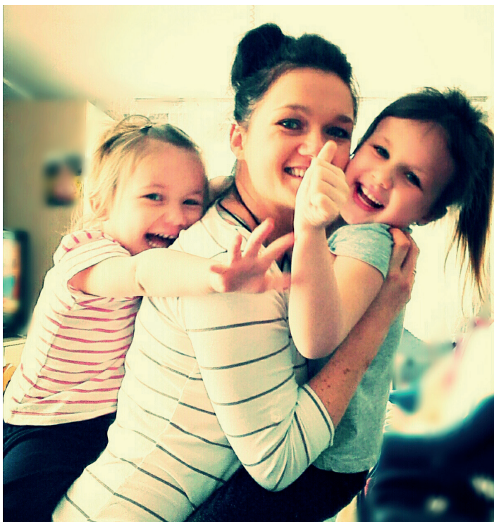
Córki były wsparciem dla mamy w procesie zmian.

świadomie. Do tego 30 min aktywności 3x w tygodniu i to wszystko.