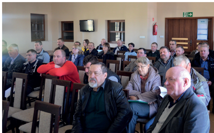
Szkolenie dla rolników.

Udział w maratonie fitness z okazji Dnia Kobiet – sołectwo Kopytkowo.