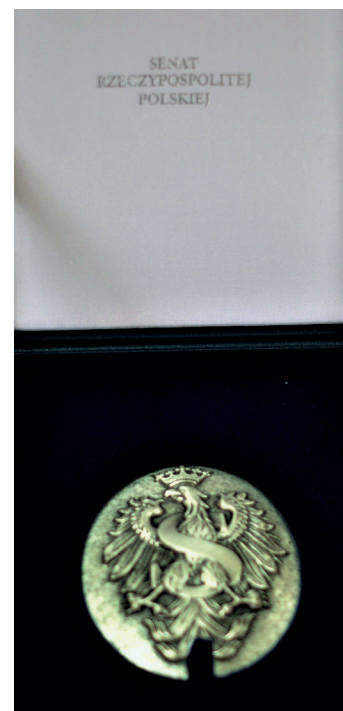
Medal Senatu to wielkie wyróżnienie dla Stowarzyszenia PONiPW Lalkowy.