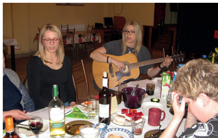
Wspólne świętowanie w sołectwie Bobrowiec.

uśmiechu i dobrej zabawy. W ten sposób, swój dzień uświetniły mieszkanki Starej Jani, Kościelnej Jani, Bobrowca, Leśnej Jani i Smętowa.