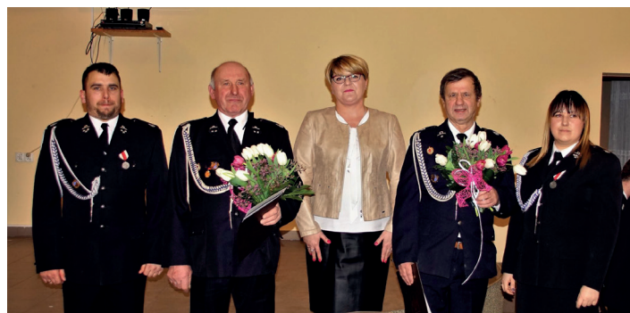
Walne Zebranie w OSP Kamionka.