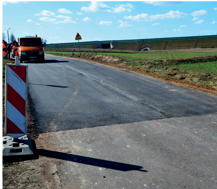
Droga w miejscowości Kamionka, tuż przed zakończeniem prac.