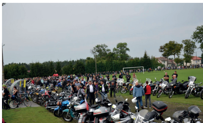
Czarne skóry, warkot silników...