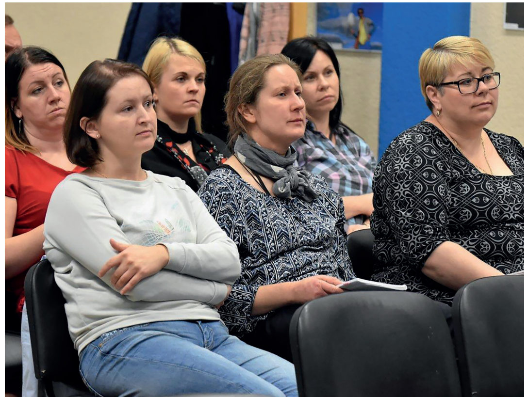
FOT. URZĄD GMINY ZBLEWO

Prelegenci omówili realizację projektów unijnych z dotychczasowych działań PROW, RPO i EFS oraz przedstawili dalsze możliwości ubiegania się o fun-