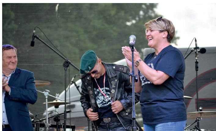
Czapl to niezwykley człowiek z pasją.