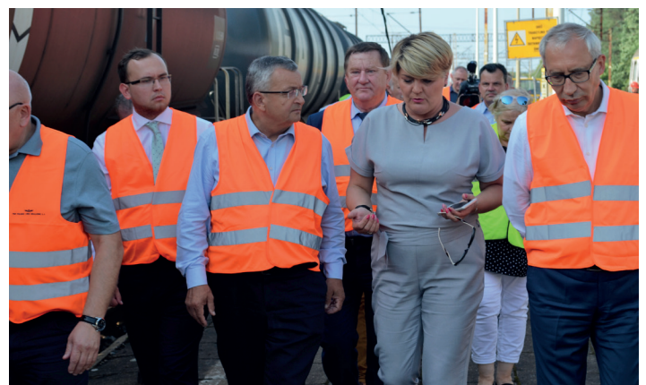
Spotkanie dzień po wypadku.