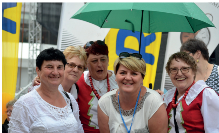
Reprezentacja Gminy Smętowo