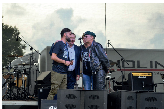
Oficjalne otwarcie zlotu.