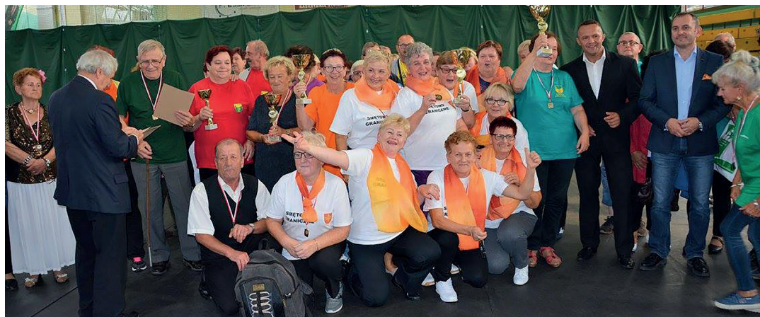
Seniorzy ze Smętowa zdobyli wspólnie drugie miejsce.