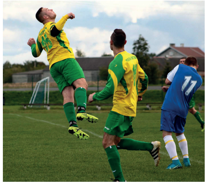
Pogoń przed wielką szansą.