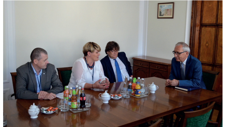
Spotkanie w Ministerstwie Infrastruktury i Budownictwa w Warszawie.