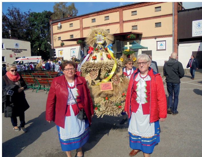
KGW Kopytkowo zaprezentowało swój wieniec.

T egoroczne Samorządowe Dożynki Powiatu Starogardzkiego odbyły się 24 września w Bolesławowie. Połączone z XII Kociewską Wystawą i Pokazem Zwierząt Hodowlanych przyciągnęły dużą liczbę zainteresowanych. Tradycyjnie można było zasmakować w kuchni regionalnej, wziąć udział w licznych konkursach, jak również podziwiać wspaniałe wieńce dożynkowe.