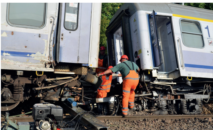
Prace na miejscu zdarzenia.