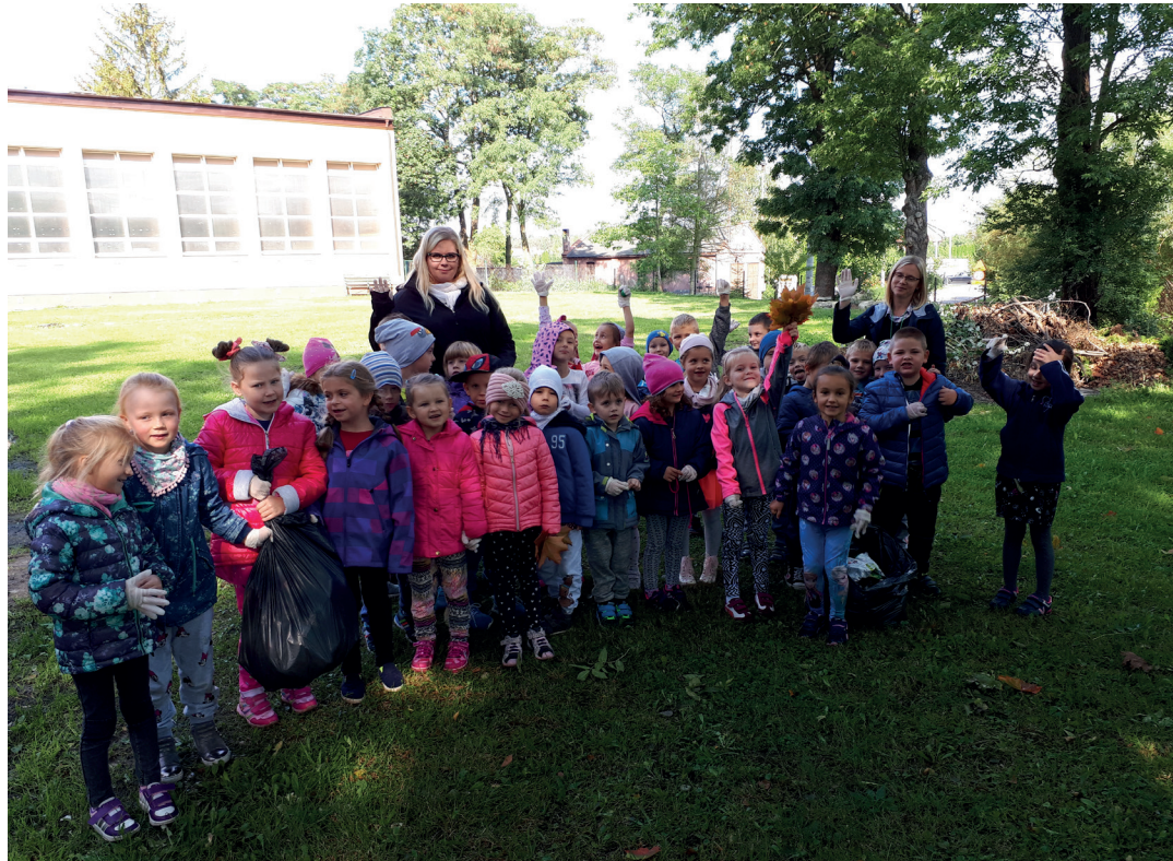
Akcja sprzątanie zaliczona na 6.