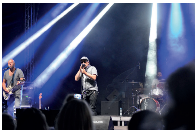
Gwiazda wieczoru: Róże Europy.