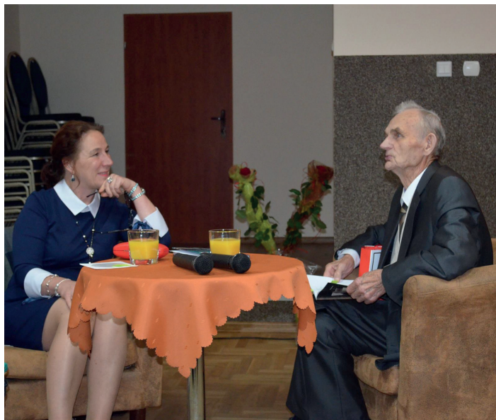
Pierwsze spotkanie autorskie w Ośrodku Kultury w Smętowie.

„(...) Nie można się zatem dziwić, że historia Ojczyzny była mu zawsze bliska. O przeszłości kraju wiedział bardzo dużo. Jego proste, chłopskie opowieści były dla nas najlepszą lekcją patriotyzmu.”