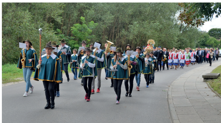
Uroczysty przemarsz dożynkowy.