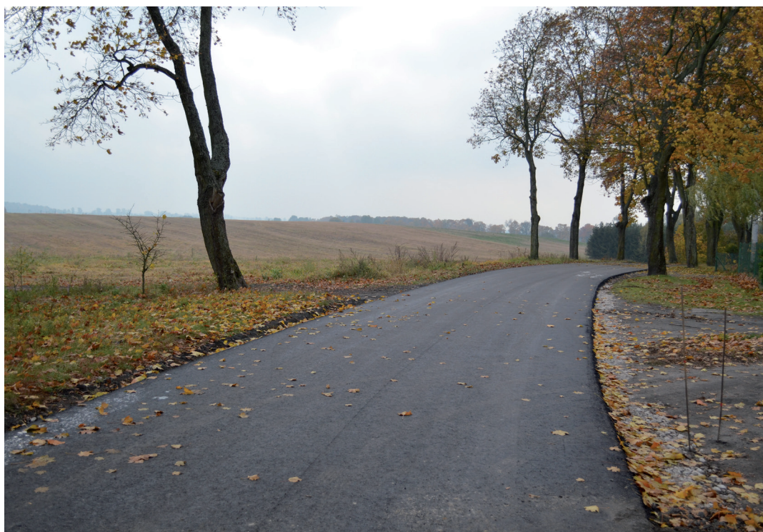
Droga gminna - miejscowość Lalkowy.