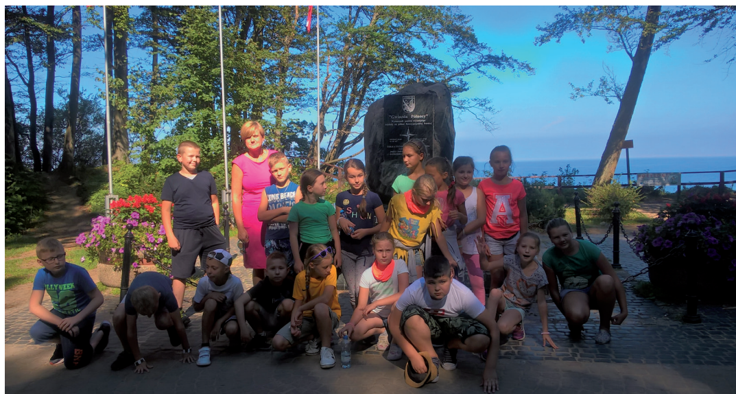
Pamiątkowe zdjęcie z Błękitnej Szkoły.

A co na to uczniowie klas VI PSP, którzy w dniach od 19 do 23 września 2016 r. uczestniczyli w