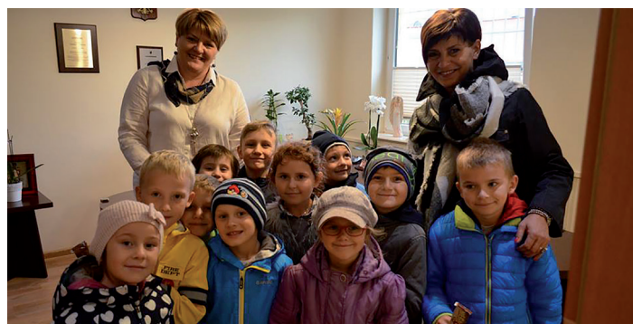
Odwiedziny pierwszaków z ZKiW w Smętowie Gr.