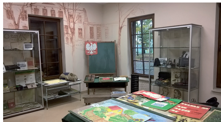
Powrót do przeszłości okazał się wspaniałą edukacyjną inicjatywą.