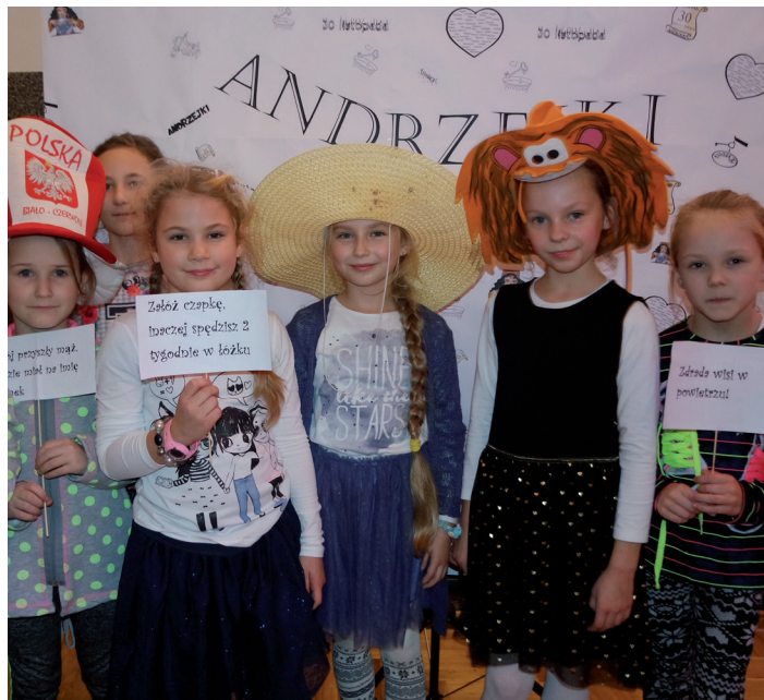
Pamiątkowe zdjęcia to podstawa każdej dobrej zabawy.

Atrakcją tego popołudnia stały się zabawy integracyjne, m.in. znikające krzeselka, taniec z balonami oraz to czego nie mogło zabraknąć w tak niesamowity dzień, a mianowicie wróżby i lanie wosku. Tradycyjne zabawy z przymrużeniem oka, pozwoliły