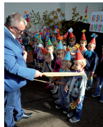
Tymczasem u świeżo upieczonych przedszkolaków.

O tym jak barwne były to uroczystości przekonają się Państwo przeglądając galerie dostępną na naszym facebook'u, do czego serdecznie zachęcamy. A dzieciom,