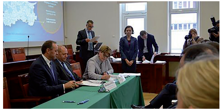
Podpisanie umowy na realizację przedmiotowego zadania.