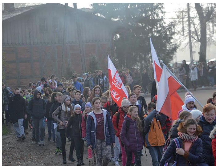
Uroczysty przemarsz młodzieży z ZKiW w Smętowie Gr.

Tegoroczny bieg był również owocem współpracy przedstawicieli samorządu oraz sektora pozarządowego, gdyż za jego organizację odpowiadali: Urząd Gminy w Smętowie Gr., Gminny Ośrodek Kultury Sportu i Rekreacji im. Stanisława Muchy w Smętowie Gr., SKF LZS „Pogoń” Smętowo, UKS