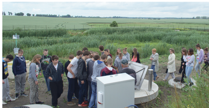
Projekt finansowany w ramach działania „Podstawowe usługi dla gospodarki i ludności wiejskiej” objętego PROW na lata 2007-2013