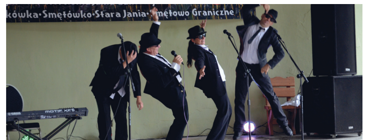
Na scenie wystąpił również kabaret DKD ze Słupska.