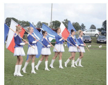
Pokaz mażorettek uświetnił tegoroczne dożynki.