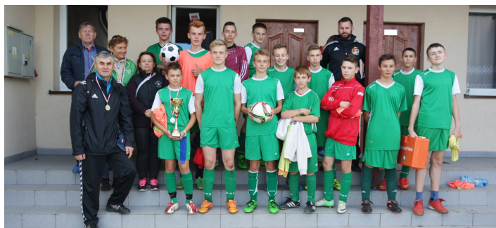
Drużyna P.G. Smętowo Graniczne

Młodzi piłkarze walczyli o Puchar Przewodniczącego Sejmiku Wojewódzkiego.