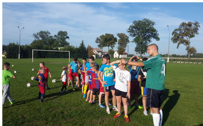
Szkółka najmłodszych zawodników Pogoni Smętowo.