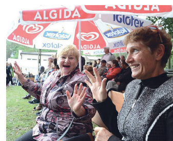
Pomimo deszczowej pogody świetny humor towarzyszył uczestnikom przez całą imprezę.