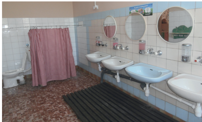
Łazienka w Przedszkolu Samorządowym przed remontem.

Zrealizowane działanie w znacznym stopniu przyczyniło się do poprawy