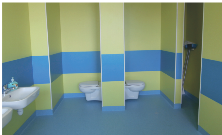
Łazienka w Przedszkolu Samorządowym po remoncie.

warunków panujących w Przedszkolu Samorządowym w Smętowie Granicznym. Stare łazienki już nie straszą, a nowe bardziej ergonomiczne i przystosowane do potrzeb