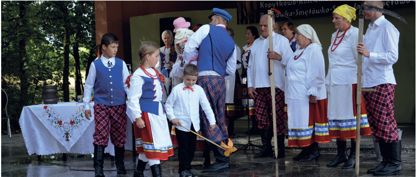
Występ zespołu Kociewska Familia podczas Dożynek 2015

Wspominamy wrzesień. Tegoroczne dożynki odbyły się 6 września na stadionie przy Gminnym Ośrodku Kultury, Sportu i Rekreacji w Smętowie Granicznym.