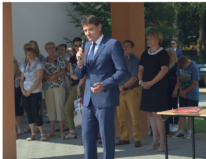
Minister Adam Korol podczas wizyty w Smętowie Gr.

Wyżej wspomniana kampania została stworzona z powodu alarmujących danych o stanie zdrowia i kondycji obecnej młodzieży oraz jej niskiej aktywności fizycznej. Akcja ma więc na celu uświadomienie młodzieży jak istotną rolę w ich życiu odgrywa sport i gimnastyka. Takie działania, systematycznie wdrażane w dalszej perspektywie mają wpłynąć na zmniejszenie ilości zwolnień z zajęć wychowania fi-