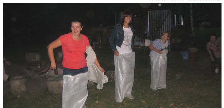
Uczestnicy Dnia Pieczonego Ziemniaka w Bobrowcu.