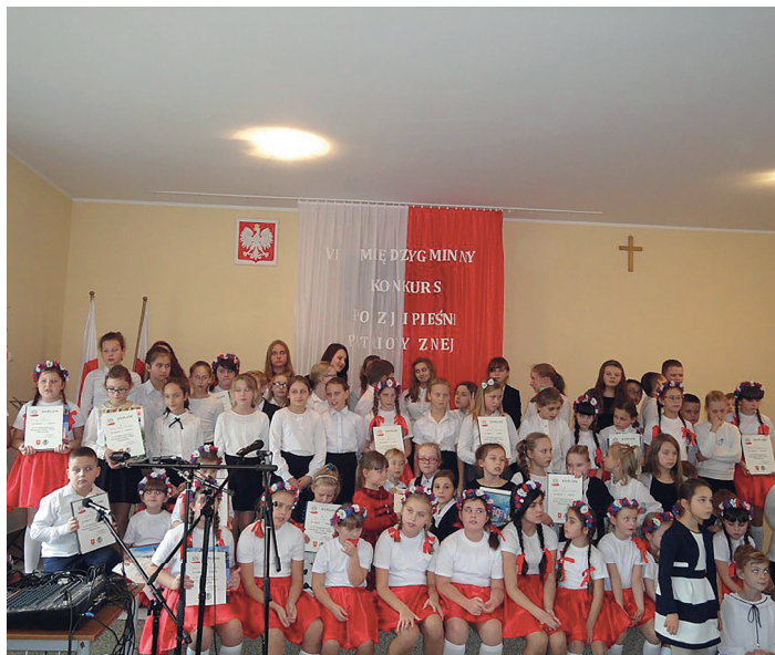
Uczestnicy VII edycji konkursu.