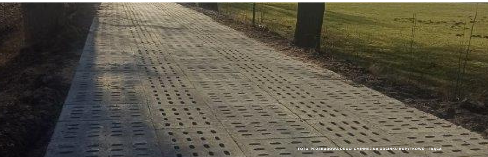
FOTO: PRZEBUDOWA DROGI GMINNEJ NA ODCINKU KOPYTKOWO - FRĄÇA