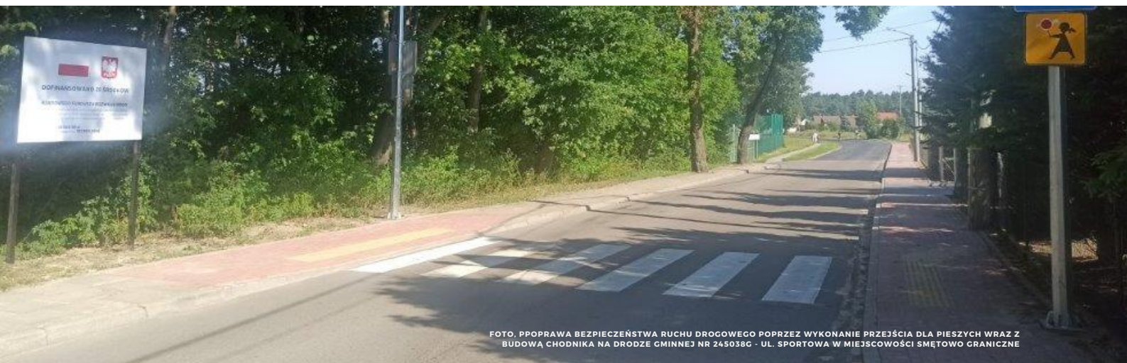
FOTO, POPRAWA BEZPIECZEŃSTWA RUCHU DROGOWEGO POPRZEC WYKONANIE PRZEJŚCIA DLA PIESZYCH WRAZ Z BUDOWĄ CHODNIKA NA DRODZE GMINNEJ NR 245038G - UL. SPORTOWA W MIEJSCOWOŚCI SMĘTOWO GRANICZNE