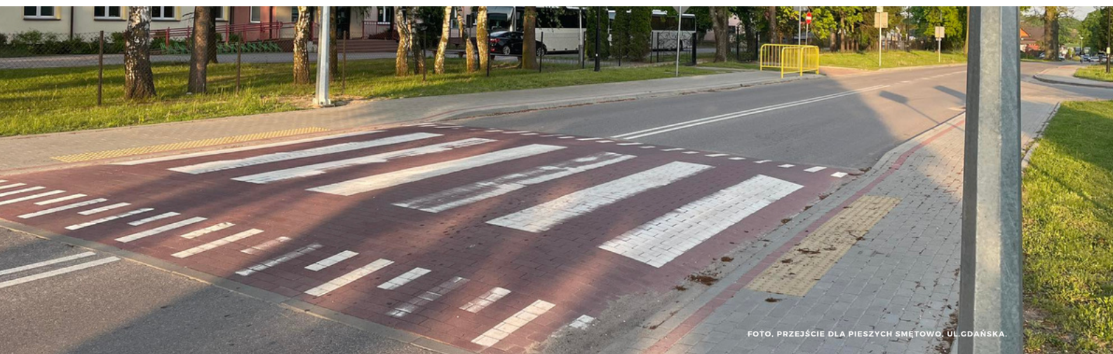
FOTO, PRZEJŚCIE DLA PIESZYCH SMĘTOWO, UL. GDAŃSKA.