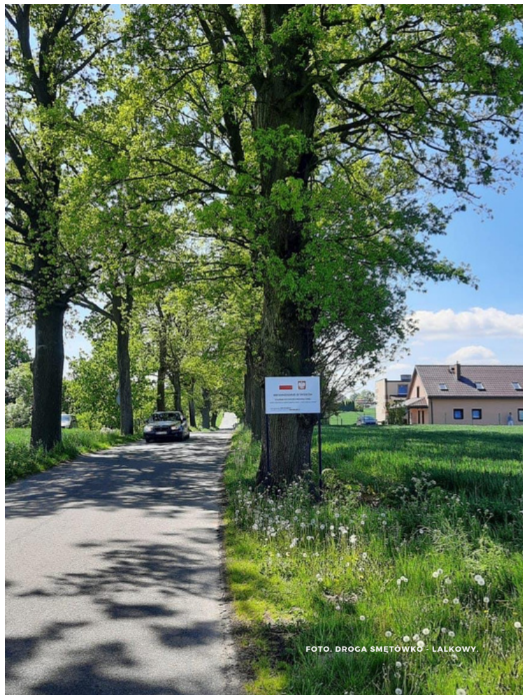
FOTO. DROGA SMĘTÓWKO - LALKOWY.

Każda inwestycja to pomysł na zrobienie czegoś nowego, oczekiwanego (krótco lub długo) przez lokalne społeczeństwo, staramy się realizować konkretne działania, tak aby były one zauważalne i odznaczone w harmonogramie jako zrealizowane. Można bez jakiegokolwiek skromności napisać, że zadań inwestycyjnych do realizacji, w trakcie realizacji lub ukończonych jest bardzo dużo. Poniżej przedstawiam zestawienie zadań inwestycyjnych w Gminie Smętowo Graniczne, które w roku 2022 były prowadzone: