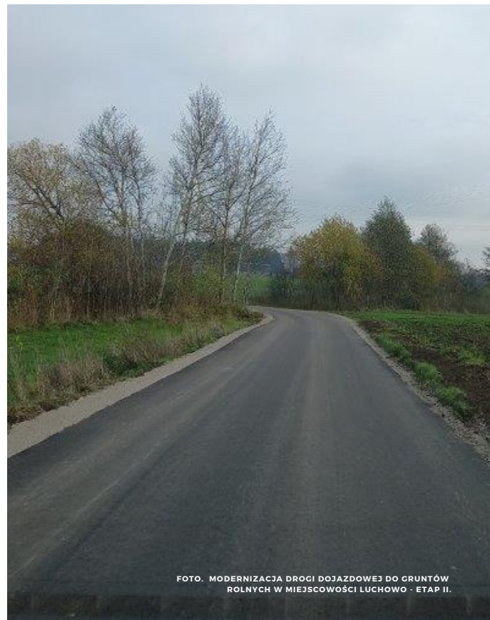
FOTO. MODERNIZACJA DRUGI DOJAZDOWEJ DO GRUNTÓW ROLNYCH W MIEJSCOWOŚCI LUCHOWO - ETAP II.