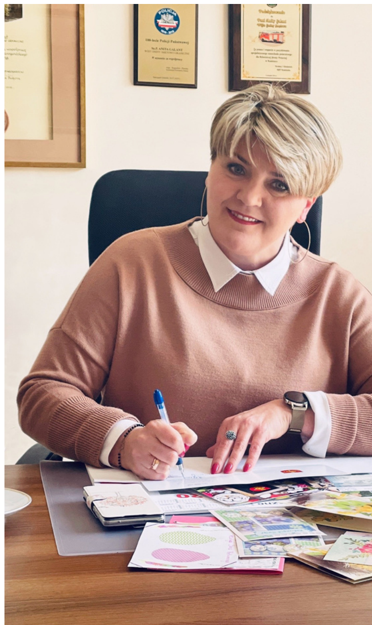
WÓJT GMINY SMĘTOWO GRANICZNE

Ustawodawca chyba podobnie pomyślał, ponieważ w 2018 roku zmienił tak przepisy, że do 31 maja 2019 roku należało przedstawić pierwszy raport o stanie gminy, który dotyczył spraw związanych z działaniami podejmowanymi w 2018 roku.